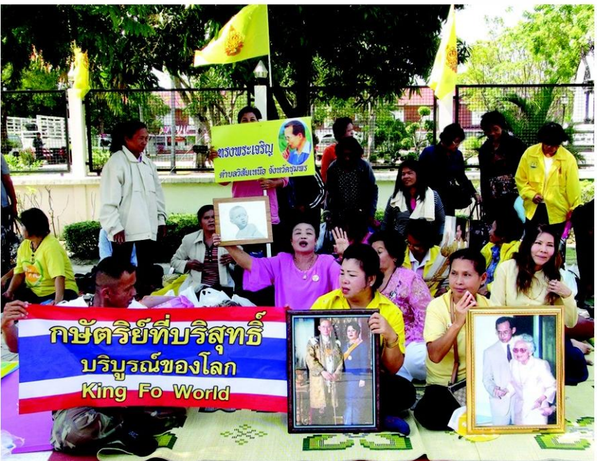
◀จงรักภักดี - พสกนิกรจากทั่วทุกสารทิศ เดินทางมาจับจองพื้นที่บริเวณวิังไกลกังวล อ.หัวหิน จ.ประจวบคีรีขันธ์ ตั้งแต่วันที่ 4 ธ.ค. เพื่อรอเฝ้าฯพระบาทสมเด็จพระเจ้าอยู่หัว ในการเสด็จออกมหาสมณคม วันที่ 5 ธ.ค.

ผู้สื่อข่าวรายงานจาก หัวหิน จ.ประจวบคีรีขันธ์ ว่า ตั้งแต่ช่วงเช้ามืดประชาชนเดินทางมาจับจองพื้นที่บริเวณหน้าวิังไกลกังวล อ.หัวหิน ด้านทิศเหนือและทิศใต้ได้อย่างเนืองแน่นตลอดแนวถนนเต็มหมัด ทั้งนี้เพื่อรอเฝ้าฯ รับเสด็จ พระบาทสมเด็จพระเจ้าอยู่หัว ที่จะเสด็จออกยังท้องพระโรง ศาลาพระราชสาสมาคม วิังไกลกังวล ทำให้การจราจรติดขัดเป็นทางยาว โดยประชาชนนำกระดาษสีเหลืองอาหารน้ำดื่ม พร้อมอุปกรณ์สำหรับนอนค้าง และพระบรมฉายาลักษณ์พระบาทสมเด็จพระ