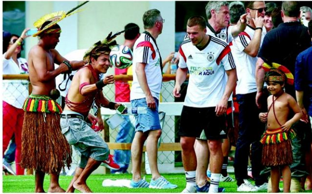
ทีมเยอรมนีต้อนรับชนพื้นเมืองบราซิลที่มาต้อนรับ

“ถ้าเราเข้ารอบลึกๆ อาจมีโอกาสได้เจอกับทีมบราซิล หรือเยอรมนี แต่ถ้าอังกฤษจะแพ้ แพ้บราซิลผมยอมรับได้ แต่ถ้าแพ้ทีมฝรั่งเศสหรือเยอรมนี ผมอาจจะเสียใจนิดหน่อย แต่ผมคิดว่าบราซิลคงเป็นแชมป์ เพราะเล่นอยู่ที่บ้านตัวเอง” ทูตอังกฤษกล่าว