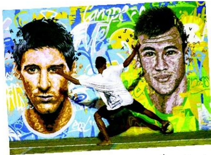
รูปเขียนสองนักเตะดาวดัง เมสซี-เนย์มาร์

หัวข้อข่าว: มนต์เสน่ห์บอลโลกบราซิลเปิดสนามคืนนี้