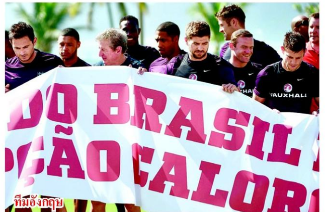
ทีมอังกฤษ

โดยส่วนตัวแล้วอยากให้อังกฤษได้แชมป์ แต่ในทัวร์นาเมนต์ก็ยังมีทีมอื่นๆ ที่เก่งมากด้วย เช่น ทีมบราซิล ที่เล่นบอลสวยงาม มีนักฟุตบอลที่มีชื่อเสียงหลายคน เช่น เนย์มาร์ ที่เล่นฟุตบอลสวยงามมาก ทีมเยอรมนี และสเปนที่เล่นฟุตบอลมีประสิทธิภาพ ทีมเบลเยียมครั้งนี้ก็