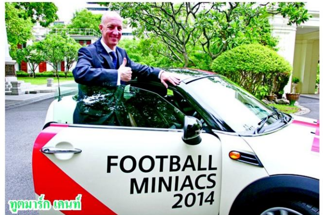
ทูตมาร์ก เลนทึ

ความตื่นตัวของแฟนฟุตบอลชาวไทยนั้นปรากฏเป็นข่าวว่าต่างประเทศอยู่เสมอ รวมถึงในปีนี้ที่ทั้งการโปรโมตด้านสินค้า สร้างบรรยากาศตกแต่งสถานที่ต่างๆ และยังมีกิจกรรมความบันเทิงและการทายผลทีมแชมป์ ซึ่งข่าวสดรวมอยู่ในขบวนเวรคัพที่เวอร์นี้ด้วย