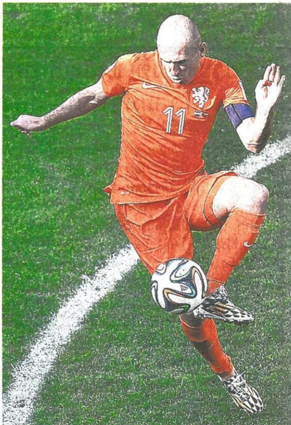
ฮอลแลนด์เป็นต่อ อาร์เยน ร็อบเบน (ขวา) ดาวยิงทีม "อัสวินส์ลี้ม" ฮอลแลนด์ แชมป์กลุ่มบี เตรียมนำทัพลงสนามทำศึกฟุตบอลโลก 2014 รอบ 16 ทีมสุดท้าย พบ "จิ้งโก้" เม็กซิโก ทีม อันดับ 2 กลุ่มเอ ซึ่งมีฮาเวียร์ เฮอร์นันเดซ กองหน้าจอมขยันอยู่ในทีม คืนวันที่ 29 มิ.ย. นี้ เวลา 23.00 น.