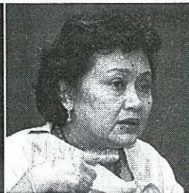
อนิรุติ ตันตราภรณ์ รมช.กระทรวงพาณิชย์