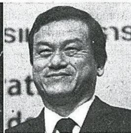
อนินันท์ โปษยานนท์ รมว.วัฒนธรรม