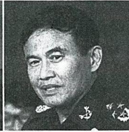
พล.อ.ไพบุลย์ คุ่มฉายา รมว.กระทรวงยุติธรรม