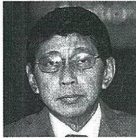
วิษณุ เครืองาม รองนายกรัฐมนตรี