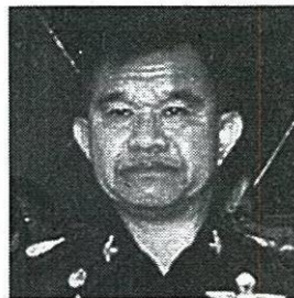
พล.ท.สุรเชษฐ์ ชัยวงศ์ รมช.ศึกษาธิการ