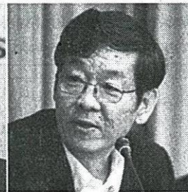
นพ.สมศักดิ์ ชุณหะวัณ รมช.กระทรวงสาธารณสุข