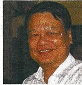
จักรมณฑท์ ฉาสุกวณิช รมว.กระทรวงอุตสาหกรรม