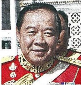
พล.อ.ประวิตร วงษ์สุวรรณ รองนายกรัฐมนตรี ควบ รมว.กระทรวงกลาโหม