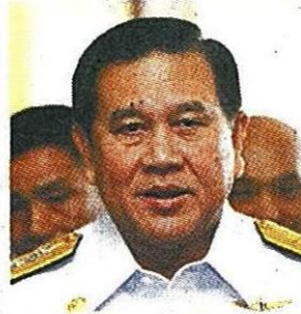
พล.อ.ณะศักดิ์ ปฎิมาประกร รองนายกรัฐมนตรี ควบ รมว.กระทรวงการต่างประเทศ