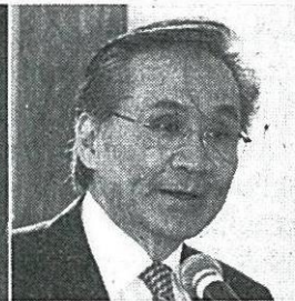
ดอน ปรมัตถ์วินัย รมช.กระทรวงต่างประเทศ