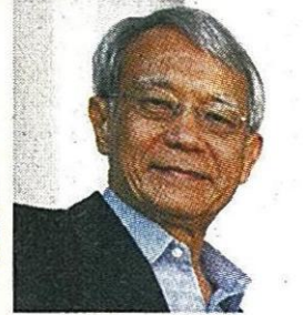
ยงยุทธ ยุทธวงศ์ รองนายกรัฐมนตรี ควบ รมว.กระทรวงวิทยาศาสตร์