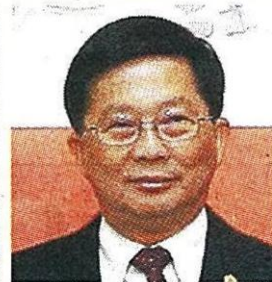
พรชัย รุจิประภา รมว.กระทรวงไอซีที