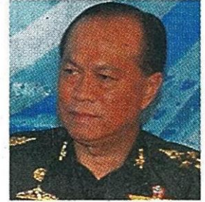
พล.อ.อนุพงษ์ เผ่าจินดา รมว.กระทรวงมหาดไทย