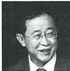
อาคม เดิมพิทยาไพสิฐ รมต.ประจำสำนักนายกรัฐมนตรี