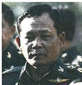
พล.อ.ดาว์พงษ์ รัตนสุวรรณ รมว.กระทรวงทรัพยากรธรรมชาติและสิ่งแวดล้อม