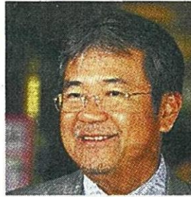
ปิติพงศ์ พิฆังบุญ ณ อุยธยา รมว.กระทรวงเกษตรและสหกรณ์