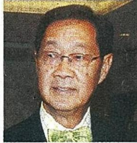
ม.ร.ว.ปรีดิยาธร เทวกุล รองนายกรัฐมนตรี คummingsเศรษฐกิจ