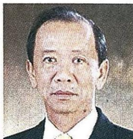
สมหมาย ภาณี รมว.กระทรวงการคลัง