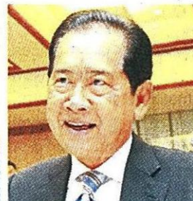
ณรงค์ชัย อัครเศรณี รมว.กระทรวงพลังงาน