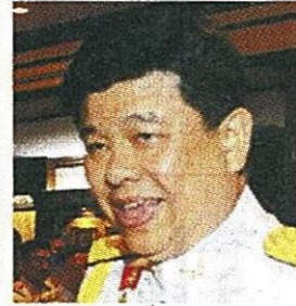
พล.อ.สุรศักดิ์ กาญจนรัตน์ รมว.กระทรวงแรงงาน