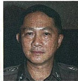
พล.ต.อ.อดุลย์ แสงสิงแก้ว รมว.กระทรวงพัฒนาสังคมฯ