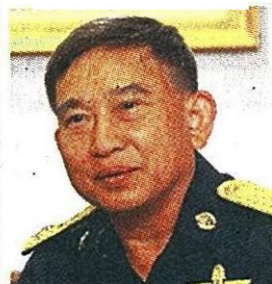
พล.อ.อ.ประจิน จั่นตอง รมว.กระทรวงคมนาคม