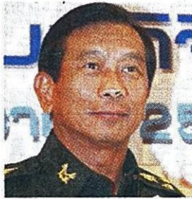
พล.อ.ฉัตรชัย สาริกัลยะ รมว.กระทรวงพาณิชย์