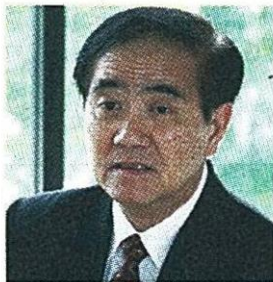
นพ.รัชตะ รัชตะนาวิน รมว.กระทรวงสาธารณสุข