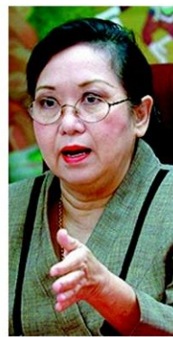
สตรี้ สัตยธรรม

สายตจว.95%พริบไม่รับ ทูลเกล้าฯถอดยศ'แม่' พท.ทั้งปม'ระเบียบ47' มีสิทธิประชามติฟัง50ล. สตรี้จี้แก้ม.37'ให้จัด 'บิกตู'ส่งสัญญาณ ก่อน สปช.โหวตร่างรัฐธรรมนูญ 6 ก.ย. เนะให้ดูทุกหมวด อย่ามองแค่ปัญหากระทบ พรรคการเมือง ซึ่งประชาชนอยากเปลี่ยนแปลง สปช.หนุน-ต้านยังล๊อบบี้กันหนัก (อ่านต่อหน้า 10)