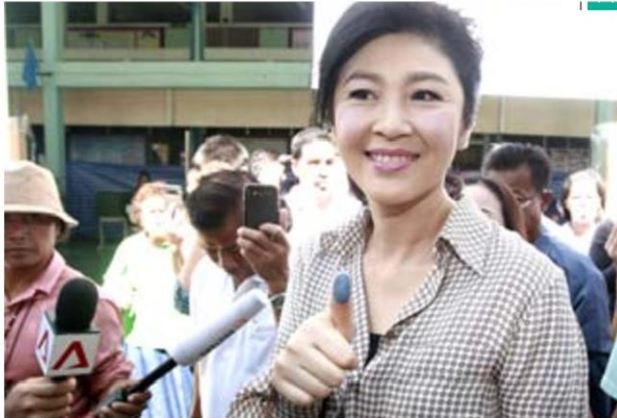
มาทั้งคู่ - พล.อ.ประยุทธ์ จันทร์โอชา (ขวา) นายกรัฐมนตรี เดินทางไปใช้สิทธิลงประชามติ ที่หน่วยออกเสียงที่ 12 เขตพญาไท ขณะนี้ น.ส.ยิ่งลักษณ์ ชินวัตร อดีตนายกฯ เดินทางไปใช้สิทธิที่ ร.ร.คลองลำเจียก เขตบึงกุ่ม ก่อนยกนิ้วโป้งโชว์รอยยิ้มให้ผู้สื่อข่าวดู วานนี้ (7 ส.ค.)