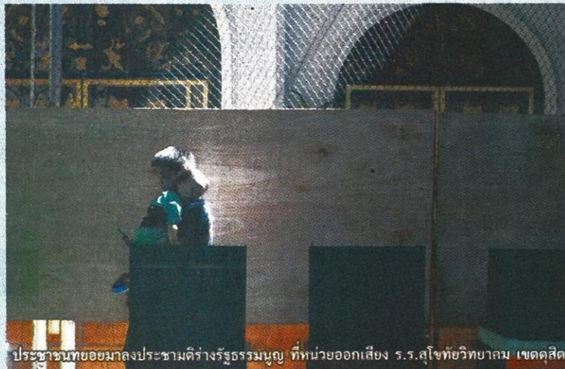
ประชาชนทยอยมาลงประชามติร่างรัฐธรรมนูญ ที่หน่วยออกเสียง ร.ร.สุโขทัยวิทยาคม เขตดุสิต