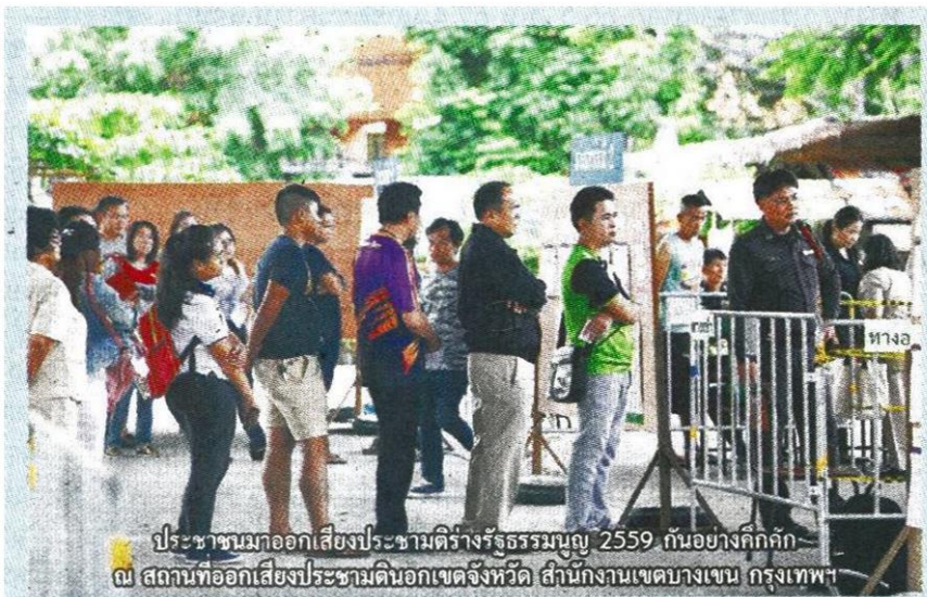
ประชาชนมาออกเสียงประชามติร่างรัฐธรรมนูญ 2559 กันอย่างคึกคัก ณ สถานที่ออกเสียงประชามตินอกเขตจังหวัด สำนักงานเขตบางเขน กรุงเทพฯ