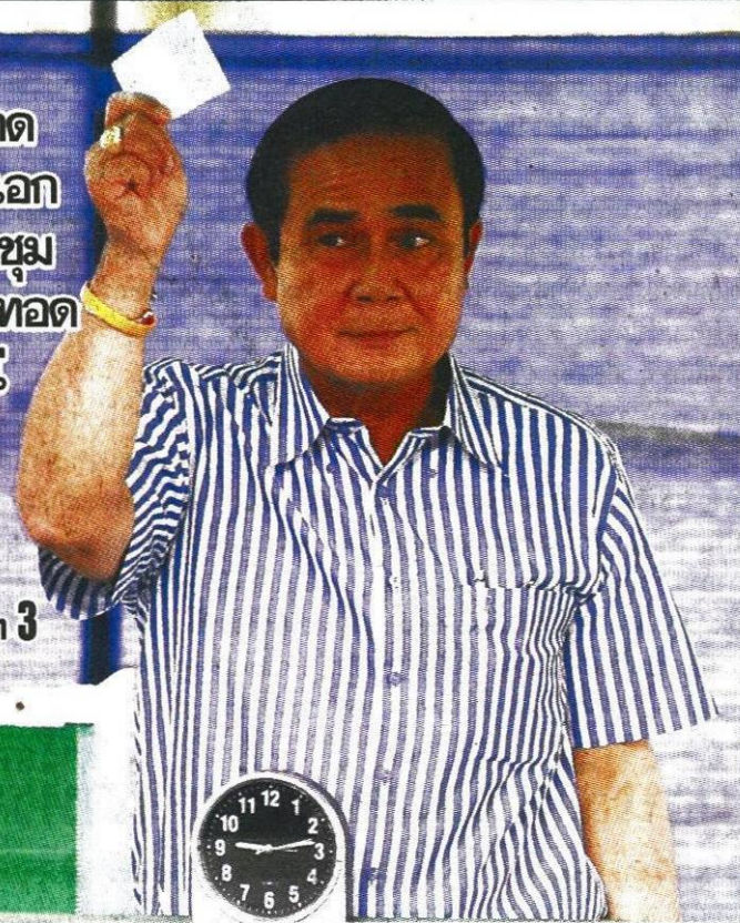
■ ใช้สิทธิ์ ■ พล.อ.ประยุทธ์ จันทร์โอชา นายกรัฐมนตรี มาออกเสียงประชามติ ที่ซอยประดิพัทธ์ 5 แขวงสามเสนใน เขตพญาไท กทม. (รูปล่าง) “เบิร์ต” ธงไชย แมคอินไตย์ ศิลปินชื่อดัง ออกเสียงประชามติ ที่หมู่บ้านสุขใจ ช.วชิรธรรมาสาธิต 43 เขตพระโขนง เมื่อวันที่ 7 ส.ค.

7 ส.ค.พร้อมใจ ลงประชามติ ชีชะตาชาติ หน้า 3