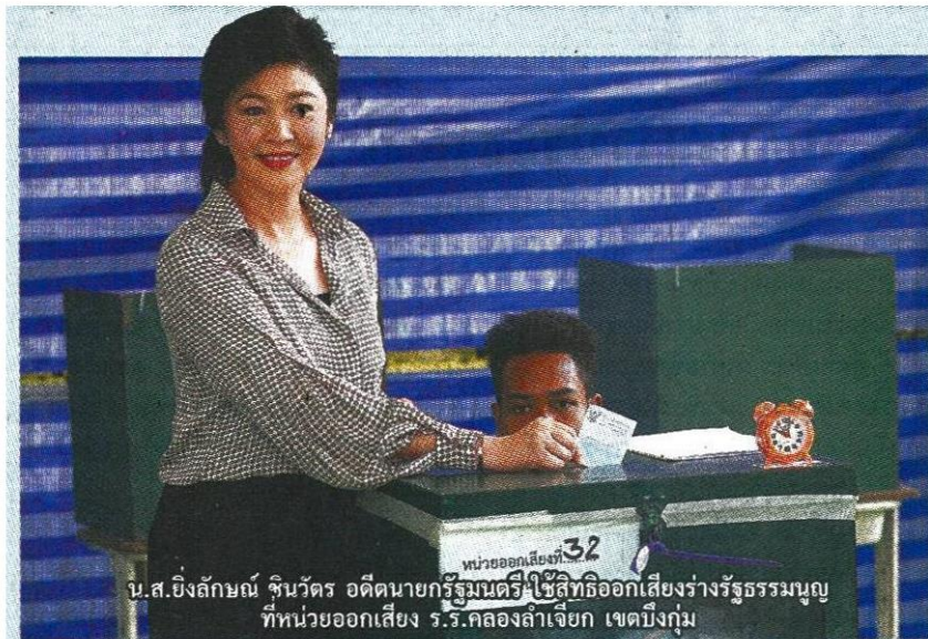
น.ส.ยิ่งลักษณ์ ชินวัตร อดีตนายกรัฐมนตรี ใช้สิทธิออกเสียงร่างรัฐธรรมนูญ ที่หน่วยออกเสียง ร.ร.คลองลำเจียก เขตบึงกุ่ม