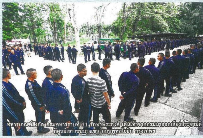
ทหารเกณฑ์สังกัดกรมทหารราบที่ 11 รักษาพระองค์ เดินเท้าจากกรมออกเสียงประชามติ ที่ศูนย์เยาวชนบางเขน ถนนพหลโยธิน กรุงเทพฯ