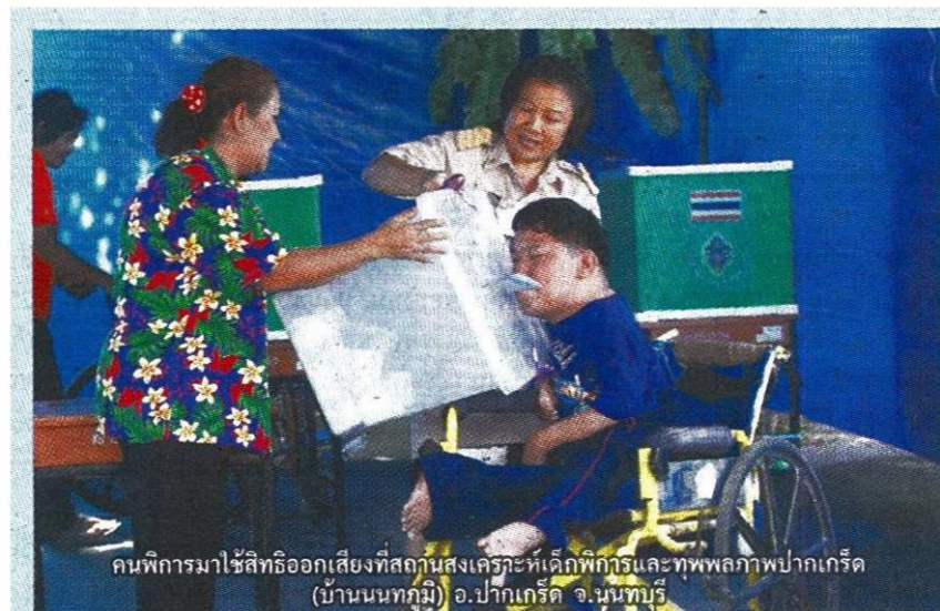
คนพิการมาใช้สิทธิออกเสียงที่สถานสงเคราะห์เด็กพิการและทุพพลภาพปากเกร็ด (บ้านนนทภูมิ) อ.ปากเกร็ด จ.นนทบุรี