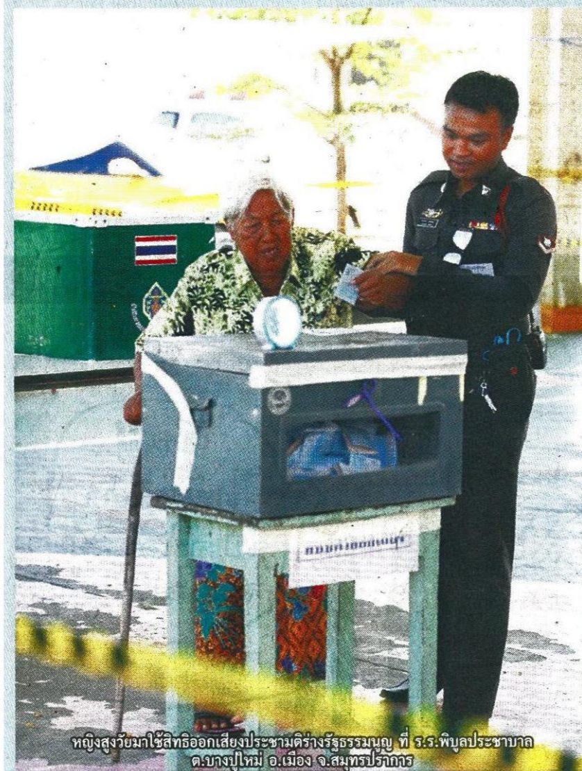
หญิงสูงวัยมาใช้สิทธิออกเสียงประชามติร่างรัฐธรรมนูญ ที่ ร.ร.พิบูลประชาบาล ต.บางปี่ใหม่ อ.เมือง จ.สมุทรปราการ