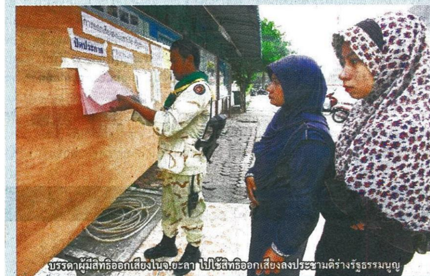
บรรดาผู้มีสิทธิออกเสียงในจ.ยะลา ไปใช้สิทธิออกเสียงลงประชามติร่างรัฐธรรมนูญ