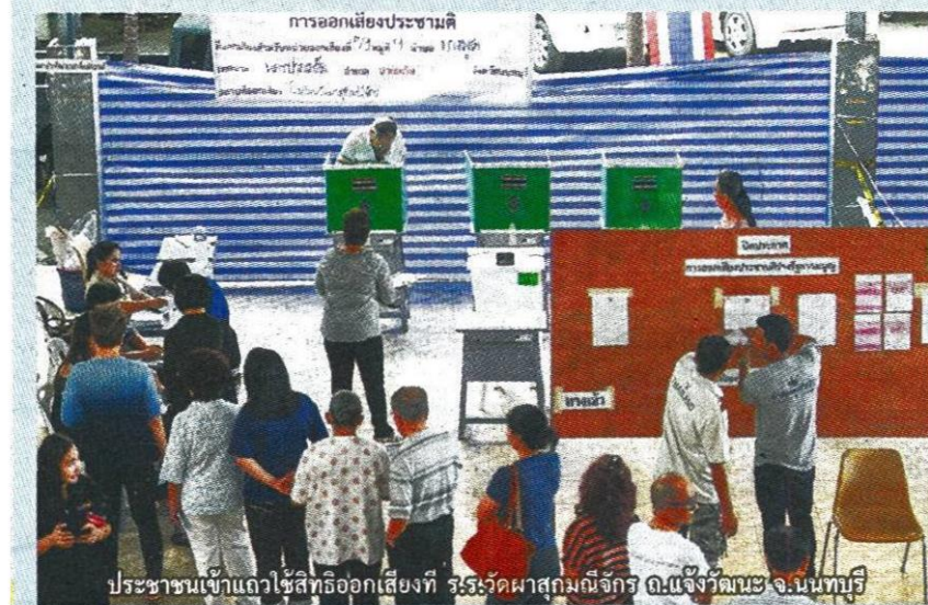
ประชาชนเข้าแถวใช้สิทธิออกเสียงที่ ไร่ระวัดผาสกมณังกร อ.แจ้ห่ม จ.สุรินทร์