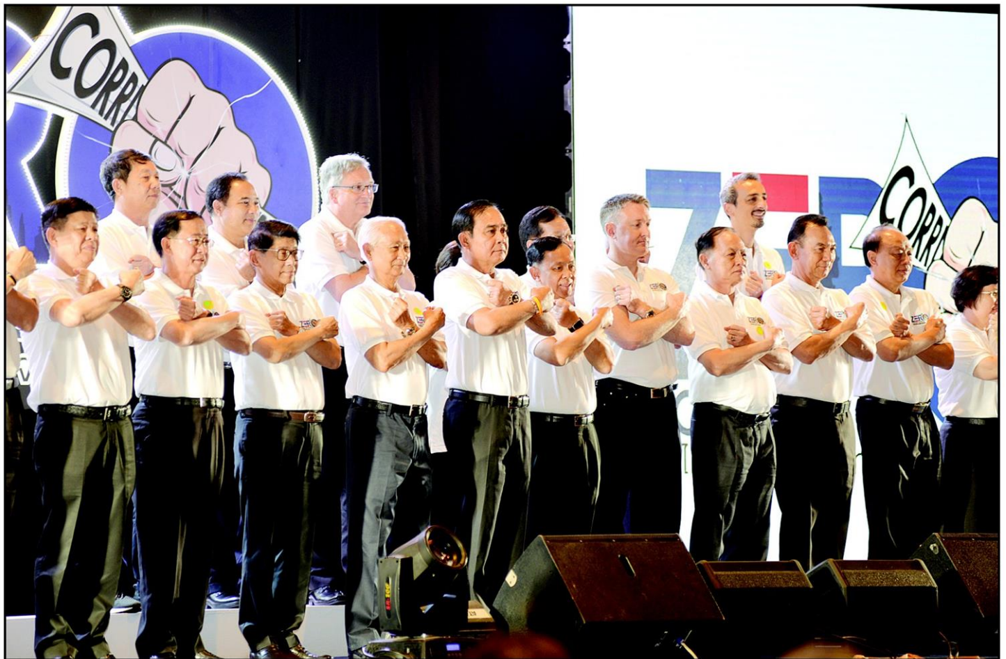
พล.อ.ประยุทธ์ จันทร์โอชา นายกรัฐมนตรีและหัวหน้าคณะรักษาความสงบแห่งชาติ (คสช.) เปิดงานวันต่อต้านคอร์รัปชันสากลที่เมืองทองธานี เมื่อวันที่เสาร์ที่ผ่านมา มีเครือข่ายต้านคอร์รัปชันทั้งจากภาครัฐและเอกชนเข้าร่วมอย่างคับคั่ง

ประมาณ 2559-2560 (ITA Awards) และรางวัลประกวดคำขวัญ "Zero Tolerance คนไทยไม่ทนต่อการทุจริต" เนื่องในวันต่อต้านคอร์รัปชันสากล (ประเทศไทย) จากนั้น พล.อ.ประยุทธ์ก็กล่าวว่า ทุกคนต้องตื่น เพราะเราจะไม่ทนต่อการทุจริตอย่างร่วมมือกับการโกง รัฐบาลขอยืนยันว่าเราพร้อมร่วมมือกับสากลป้องกันไม่ให้เกิดการทุจริตคอร์รัปชัน แต่การประเมินความ