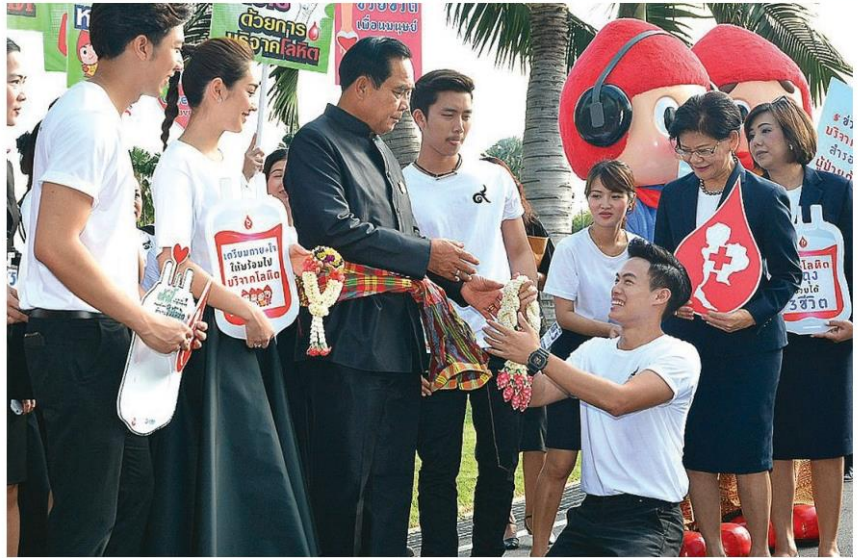
🏠 เชิญชวน -ดารานักแสดงเชิญพล.อ.ประยุทธ์ จันทร์โอชา นายกฯ ร่วมรณรงค์ประชาสัมพันธ์ บริจาคโลหิตในโครงการ 'แล้วนี้ ทำดีเพื่อพ่อ สานต่อที่พ่อทำ ด้วยการให้โลหิต' ช่วงเทศกาลสงกรานต์ ที่ทำเนียบรัฐบาล เมื่อวันที่ 11 เม.ย.

เปิดโพล! สงกรานต์ 'บขส.'สั่ง เพิ่มเที่ยว โพลอยากราดน้ำสงกรานต์ 'บิกตู'มากที่สุด'ณเดชน์' ☐ อ่านต่อหน้า 10