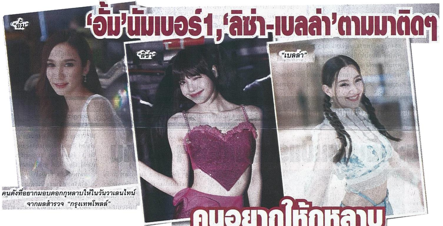
คนดังที่อยากมอบดอกกุหลาบให้ในวันวาเลนไทน์ จากผลสำรวจ "กรุงเทพโพลล์"

หัวข้อข่าว: 'อ้ม' นัมเบอร์ 1, 'ลิซ่า-เบลล่า' ตามมาติดๆ คนอยากให้กุหลาบวันวาเลนไทน์มากที่สุด