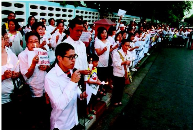
จุดเทียนสันติภาพที่โชคชัย 4 เขตลาดพร้าว

หัวข้อข่าว: โพลชี้ 80%คนไทยจะไปกาบัตรจุดเทียนสว่างทั่วกรุงตจว.ด้วย-ตะโกนลั่น'เรสเปกต์มาย...'