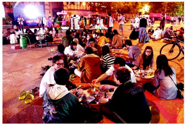
กินสุกี้รอเลือกตั้ง ที่ช่วงประตูท่าแพ จ.เชียงใหม่