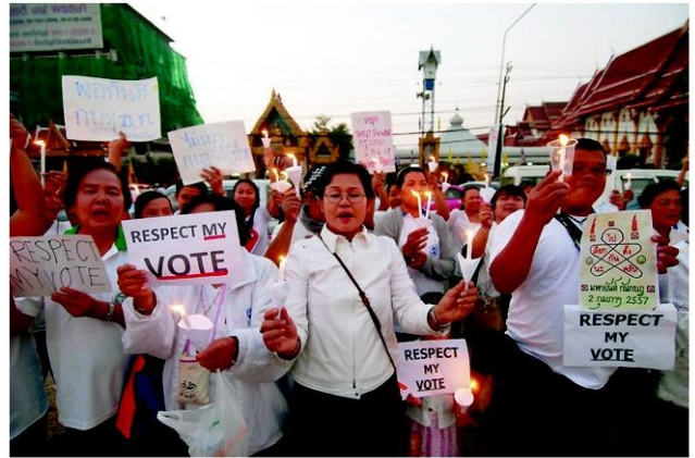
หน้าวัดเสมียนนารี เขตจตุจักร