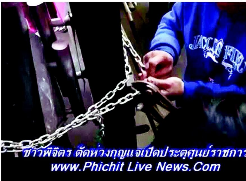
ข่าวพีชิต ดัดห่วงกัญแจเปิดประตูศูนย์ราชการ www.Phichit Live News.Com

ที่กิจกรรมจุดเทียน ปล่อยลูกโป่งรณรงค์ไป เลือกตั้งยังลึกลับทั่วทุกจังหวัด ททท.จุดเทียน ผูกผ้าขาวเต็มสกายวอล์ก สถานีรถไฟฟ้า ชองนันทรี ตะโกน"เลือกตั้ง"กระหึ่ม เชิญ