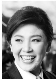
ยิ่งลักษณ์ ชินวัตร

ปฏิรูปการเมืองสำเร็จ...ต้องปฏิรูปที่ตัวนักการเมืองอันดับแรก...“หนังสือพิมพ์บ้านเมือง” ฉบับวันอาทิตย์ที่ 30 มีนาคม พุทธศักราช 2557 ...● ปฏิรูปก่อนเลือกตั้ง...หรือ...เลือกตั้งก่อนปฏิรูป...“อัครวิชัย” เห็นว่าไม่ใช่ประเด็นปัญหาสำคัญในเวลานี้ ที่ขัดแย้งระหว่าง “เพื่อไทย” ของ นายฯ ยิ่งลักษณ์ ชินวัตร กับ “มวลมหาประชาชน” ของ “กำนัน-สุเทพ เทือกสุบรรณ” จะมาตั้งป้อมใส่กันแบบชนิด...ไม่ลดราคาดอก แต่ประเด็นสำคัญ “อัครวิชัย” เห็นว่าอยู่ที่ทั้ง 2 ฝ่ายควรหันกลับไปสำรวจตัวเอง ใครมีเป้าหมาย...เพื่อผลประโยชน์ชาติโดยรวม...หรือ...เพื่อผลประโยชน์ส่วนตัว...มากกว่ากัน!!!! ...● กับที่ประชุม 53 พรรคการเมืองวันวาน มีมติให้ กกต.ไปคุยกับรัฐบาล ออกพ.ร.ฎ.เลือกตั้งภายใน 60 วัน นับจากศาล รธน.สั่งโมฆะเลือกตั้ง ส.ส. เมื่อวันที่ 2 ก.พ.57 ลงในราชกิจจานุเบกษาแล้ว ด้วยเหตุผล...ให้ระบอบประชาธิปไตยเดินหน้าต่อไปได้ “อัครวิชัย” เห็นว่าในสถานการณ์สังคมวิกฤตขัดแย้ง-แตกแยกเช่นนี้ เป็นเหตุผลไม่เพียงพอ เพราะหาก “การเลือกตั้ง” ไม่เป็นที่ยอมรับของมวลชนทุกฝ่าย ต่อให้จัดเลือกตั้งอีกกี่ครั้ง...ก็ไม่จบพับผ่า!!!! ...● “อัครวิชัย” อยากให้ทุกฝ่ายทบทวนกับการใช้ “อำนาจรัฐ” ในโลกประชาธิปไตย มี 3 ส่วนหลักๆ คือ ต้องเป็นการใช้อำนาจที่ถูกต้องตามกฎหมาย-ไม่ขัดต่อประเพณีอันดีงาม ต้องเป็นการใช้อำนาจที่มีความชอบธรรม-เป็นที่ยอมรับของประชาชน และการใช้อำนาจต้องอยู่ในกรอบของศีลธรรมและจริยธรรม