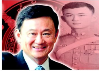
ถอดยศทักษิณ ในมุกกลับ 5