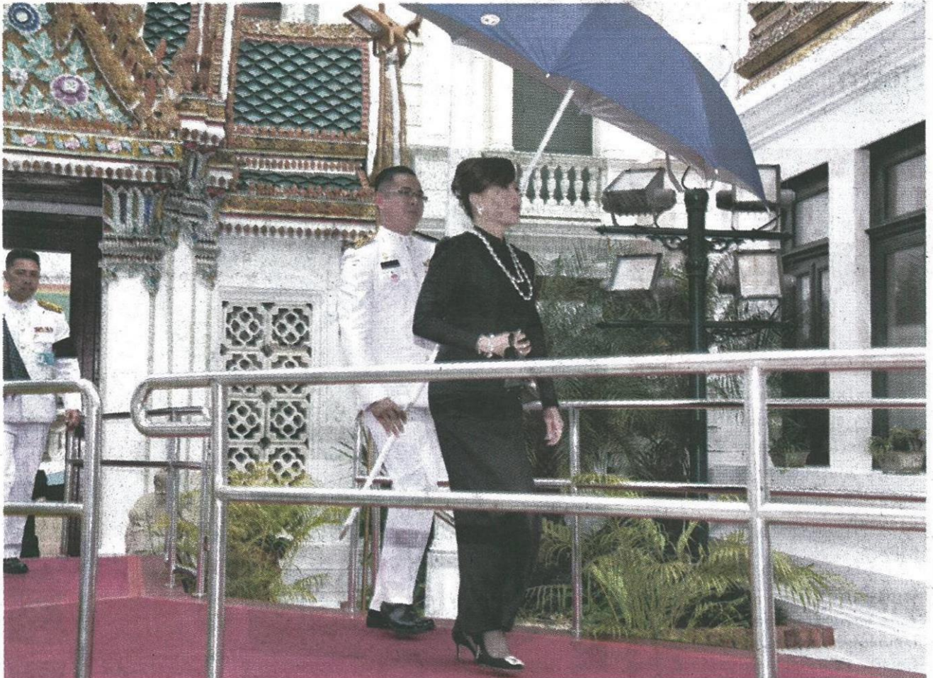
วันที่ ๒๐ พฤศจิกายน ๒๕๕๙ เวลา ๑๕.๑๕ น. ทูลกระหม่อมหญิงอุบลรัตนราชกัญญา สิริวัฒนาพรรณวดี เสด็จไปในการพระพิธีธรรมสวดพระอภิธรรม พระบรมศพ พระบาทสมเด็จพระปรมินทรมหาภูมิพลอดุลยเดช มหิตลาธิเบศรรามาธิบดี จักรีนฤบดินทร สยามินทราธิราช บรมนาถบพิตร ณ พระที่นั่งดุสิตมหาปราสาท ในพระบรมมหาราชวัง