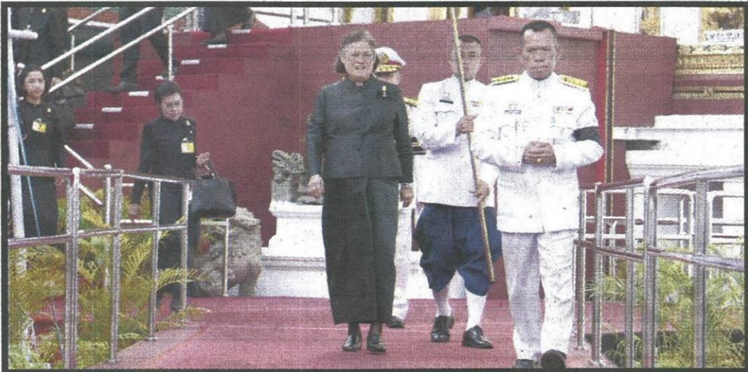
วันที่ ๒๐ พฤศจิกายน ๒๕๕๙ เวลา ๐๖.๕๙ น. สมเด็จพระเทพรัตนราชสุดาฯ สยามบรมราชกุมารี เสด็จฯ ไปทรงบำเพ็ญพระราชกุศลถวายภัตตาหารเช้าแด่พระพิธีธรรม ในการพระพิธีธรรมสวดพระอภิธรรมพระบรมศพ พระบาทสมเด็จพระปรมินทรมหาภูมิพลอดุลยเดช มหิตลาธิเบศรรามาธิบดี จักรีนฤพดินทร สยามินทราธิราช บรมนาถบพิตร ณ พระที่นั่งดุสิตมหาปราสาท