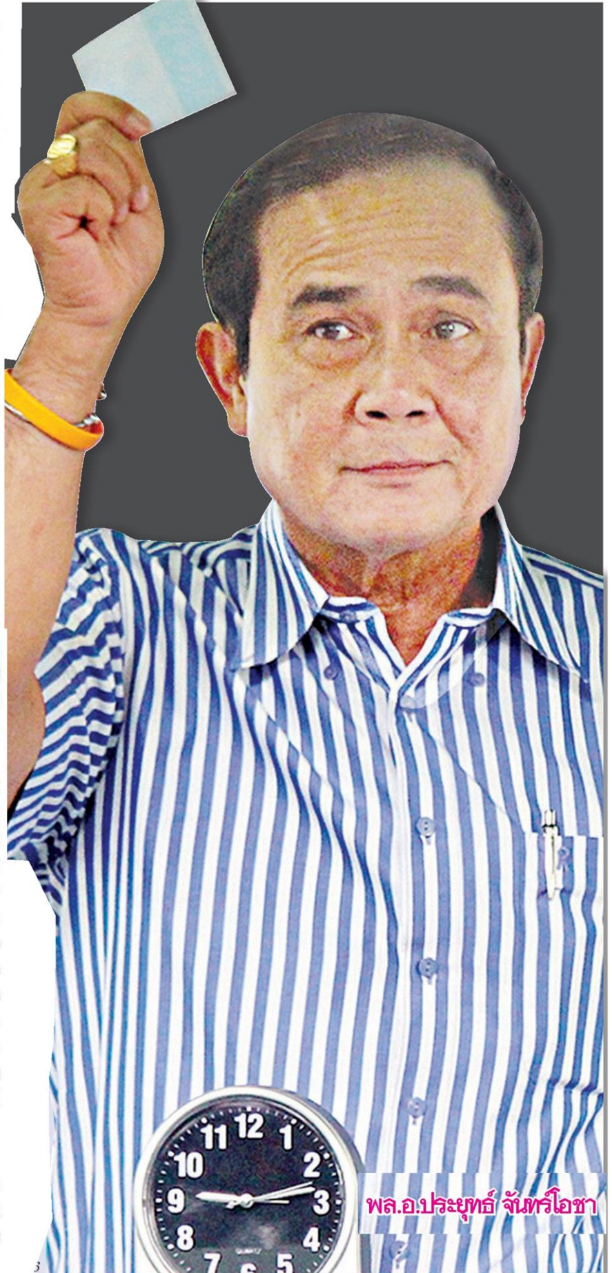
พล.อ.ประยุทธ์ จันทร์โอชา

“อยากให้รัฐบาลเร่งการลงทุนของภาค รัฐอย่างต่อเนื่อง โดยเฉพาะโครงสร้างพื้นฐาน ซึ่งขณะนี้ต้องยอมรับว่า คืบหน้าไปมากรวม