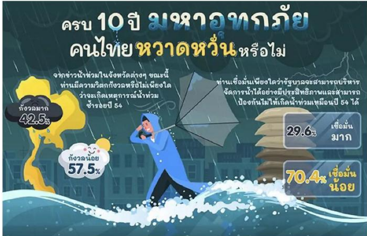
คนไทยไม่กังวลน้ำท่วมซ้ำรอยมหาอุทกภัยปี54

ข่าวน้ำท่วมในจังหวัดต่างๆ ขณะนี้ ประชาชนส่วนใหญ่ ร้อยละ 57.5 มีความกังวลค่อนข้างน้อยถึงไม่กังวลเลยว่าจะเกิดเหตุการณ์น้ำท่วมซ้ำรอยปี 54 ขณะที่ ร้อยละ 42.5 มีความกังวลค่อนข้างมากถึงมากที่สุด