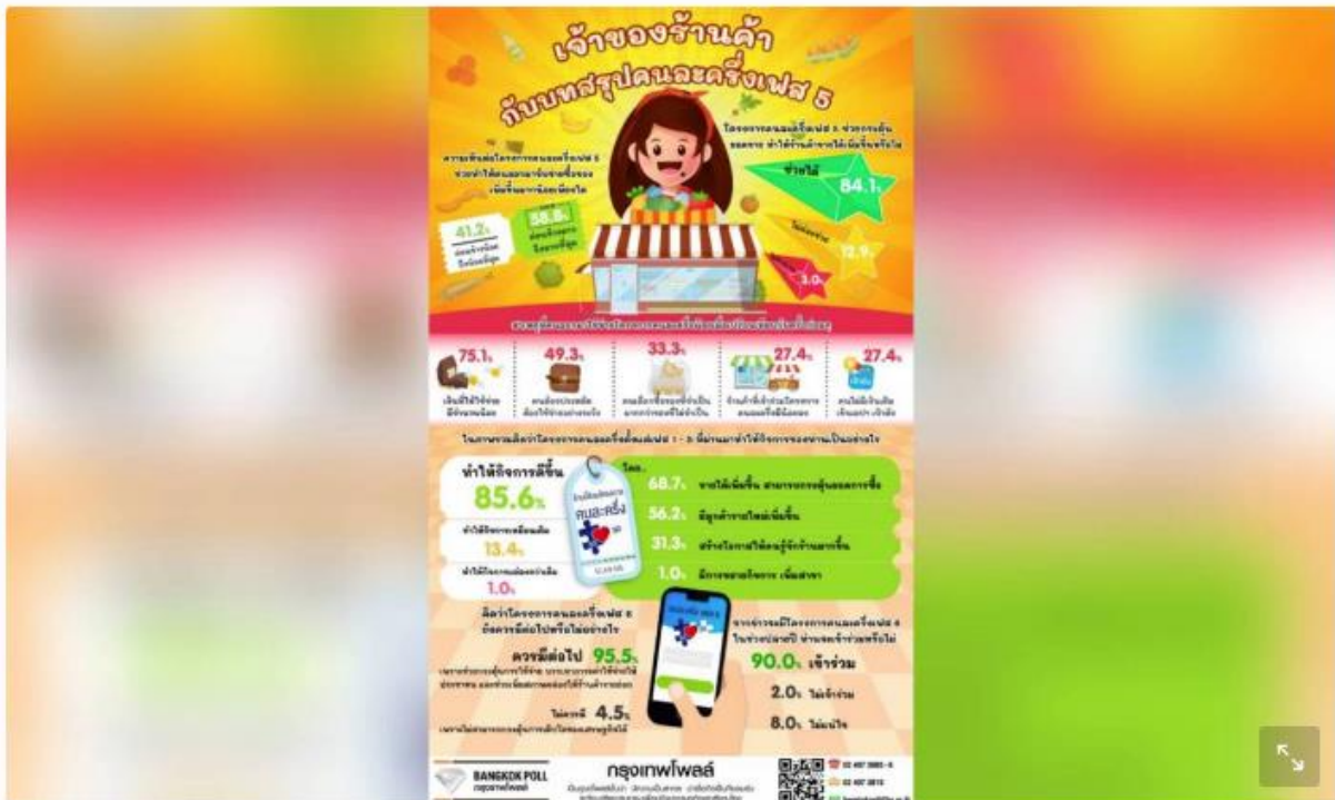
โครงการคนละครึ่ง

29 ต.ค.2565 - กรุงเทพโพลส์โดยมหาวิทยาลัยกรุงเทพ เปิดเผยสำรวจความคิดเห็นของเจ้าของร้านค้าที่เข้าร่วมโครงการคนละครึ่งพบว่า เจ้าของร้านค้าส่วนใหญ่ร้อยละ 58.8 เห็นว่าโครงการคนละครึ่งเฟส 5 ช่วยทำให้คนออกมาจับจ่ายซื้อของเพิ่มขึ้นค่อนข้างมากถึงมากที่สุด ขณะที่ร้อยละ 41.2 เห็นว่าช่วยได้ค่อนข้างน้อยถึงน้อยที่สุด