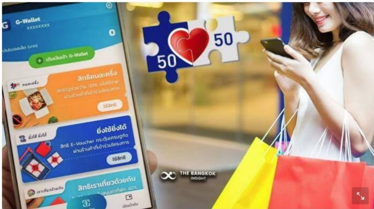
คนละครึ่ง

และเมื่อถามว่า อยากให้มีโครงการ คนละครึ่ง ต่อไปหรือไม่ ร้อยละ 69.3 ระบุ อยากให้มีต่อไป จนกว่าสถานการณ์โควิด-19 จะหายไป ขณะที่ร้อยละ 30.7 ไม่อยากให้มี อยากให้นางบประมาณไปใช้อย่างอื่นมากกว่า